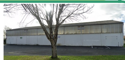
Gymnase Municipal Sol PVC, vestiaires, douches Restauration sur place