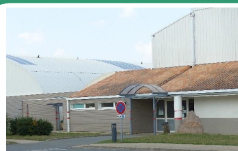
Gymnase Jacky Héraud Sol PVC, vestiaires, douches Restauration sur place