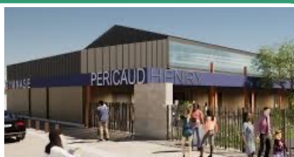
Gymnase Henry Péricaud Sol PVC, vestiaires, douches