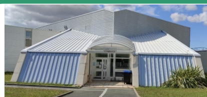
Gymnase Pinaud Sol PVC, vestiaires, douches Restauration sur place