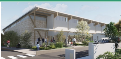
Gymnase Municipal Sol PVC, vestiaires, douches Restauration sur place