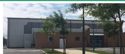
Salle Polyvalente Sol PVC Restauration sur place